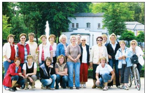
19 Batenhorster Frauen machten sich mit dem Fahrrad auf den Weg nach Bad Lippspringe. Über die Römer- und Kaiserstraße, mit Zwischenstopp in Schloß Neuhaus (Bild) wurde der Zielort erreicht. Nach dem Frühstück am nächsten Morgen ging es bei gutem Wetter über die LGS-Route und dem Emsradweg wieder Richtung Heimat.