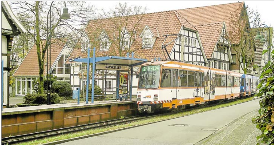
Haltestelle „Ratskeller“: So wie auf dieser Bildmontage stellt sich Fachabiturient Benedict Diederich die Rheda-Wiedenbrücker Straßenbahnlinie vor: Die Stadtverwaltung hat sich des Themas angenommen. In Kürze soll eine Machbarkeitsstudie in Auftrag gegeben werden.

Die örtlichen Umweltschutzverbände begrüßen das Straßenbahnprojekt ebenfalls. „Dadurch dürfte Rheda-Wiedenbrück mit Sicherheit zu einer der umweltfreundlichsten Städte des Landes werden“, freute sich Nabu-Vorsitzender Ewald Birkholz in einer ersten Stellungnahme.