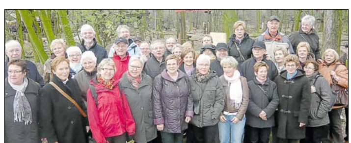
Die Europäische Kulturhauptstadt Essen und Oberhausen waren die Ziele der Landfrauen aus Rheda und ihrer Gäste.